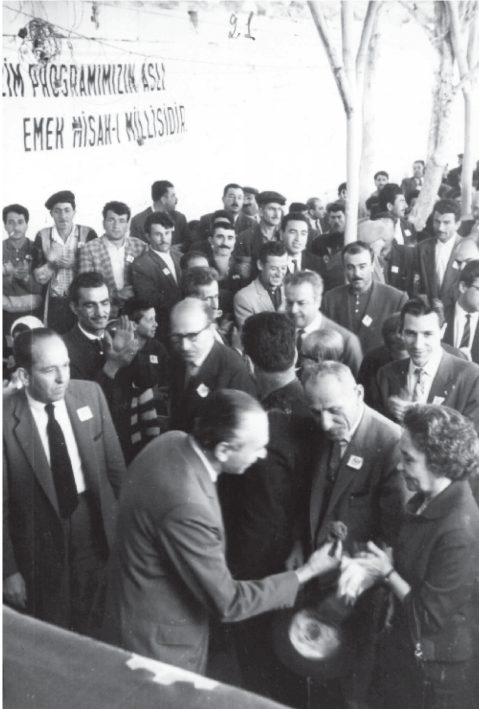
12 Mayıs 1963, Türkiye İşçi Partisi Genel Yönetim Kurulu üyeleri Gaziantep'te toplantıda. TİP Genel Başkanı Mehmet Ali Aybar kendi davetiyle partiye üye olan Behice Boran'a karanfil uzatıyor.

Kaynak: TÜSTAV, TİP Arşivi, Behice Boran Arşiv Fonu; Kadın Özel Arşivlerinde 40 Kadın 40 Hayat, Kolektif, İBB Yayınları, s. 663