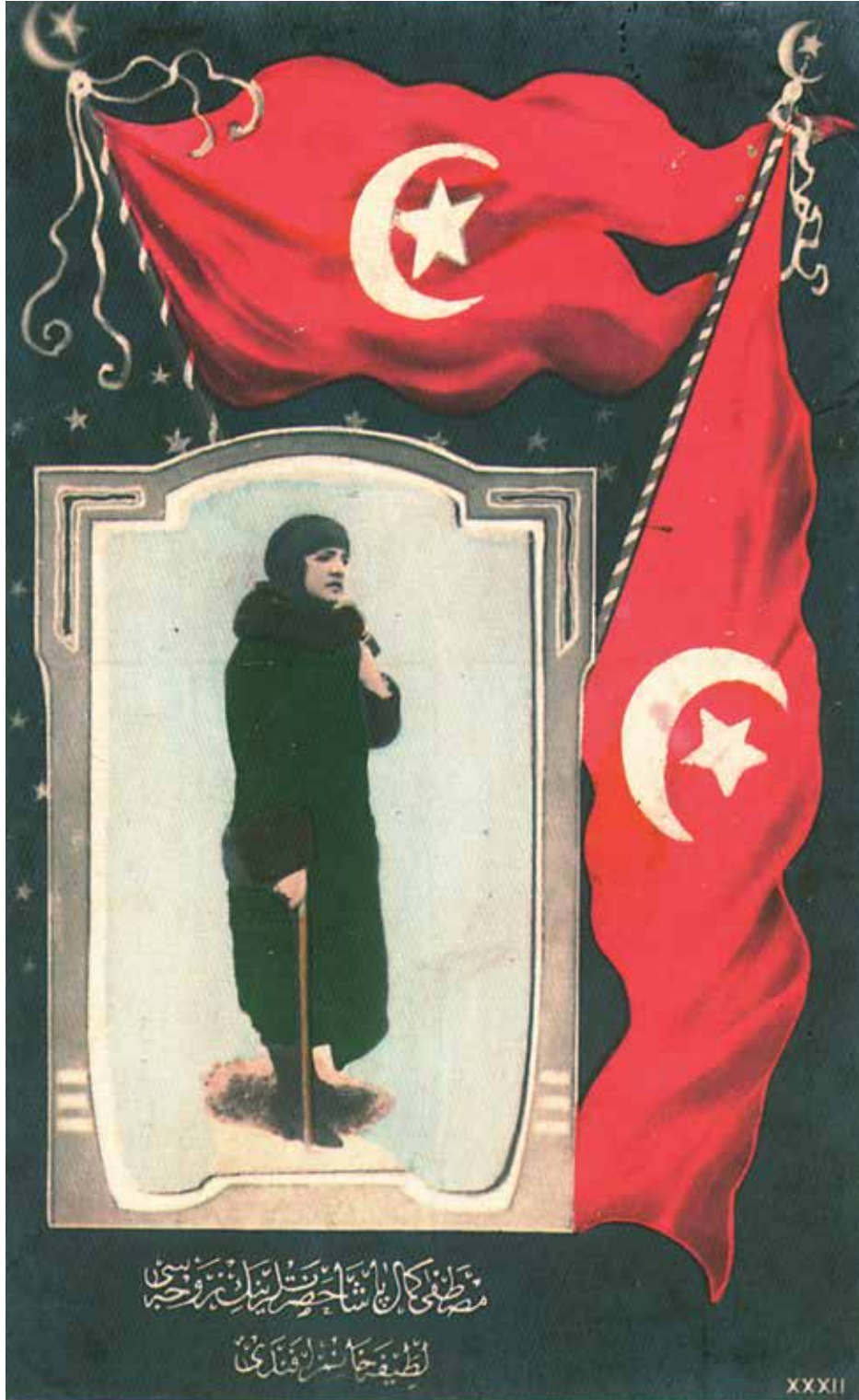
Latife Hanım'ı Türk bayraklarıyla gösteren kartpostal.