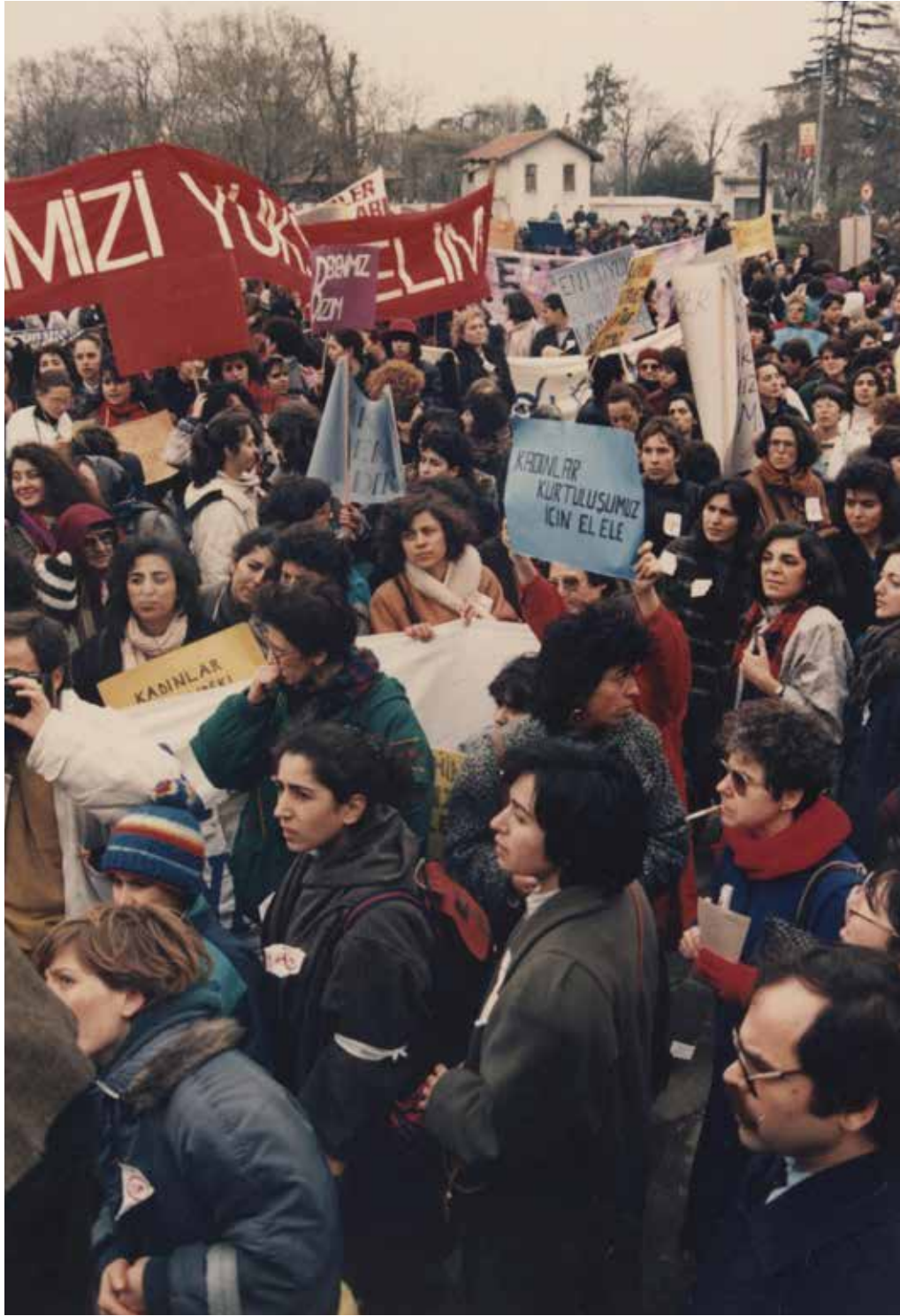
8 Mart 1989, İstanbul'da düzenlenen 8 Mart Dünya Emekçi Kadınlar Günü yürüyüşünde ellerinde döviz ve pankartlarla kalabalık kadın grubunu gösteren fotoğraf.