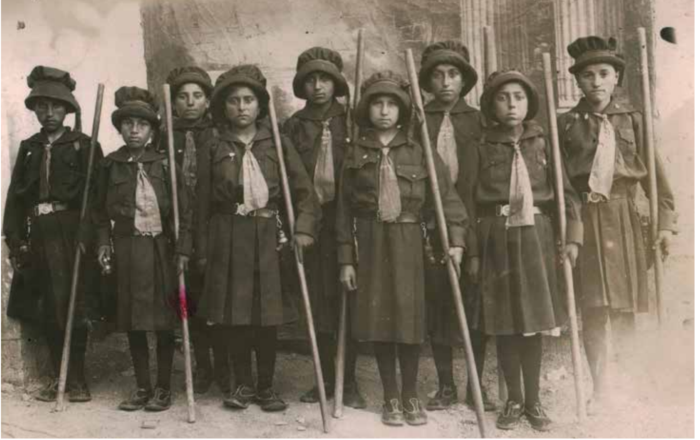
22 Temmuz 1925, Sivas Merkez İlk Kız Mektebi izci öğrencilerinin fotoğrafı.