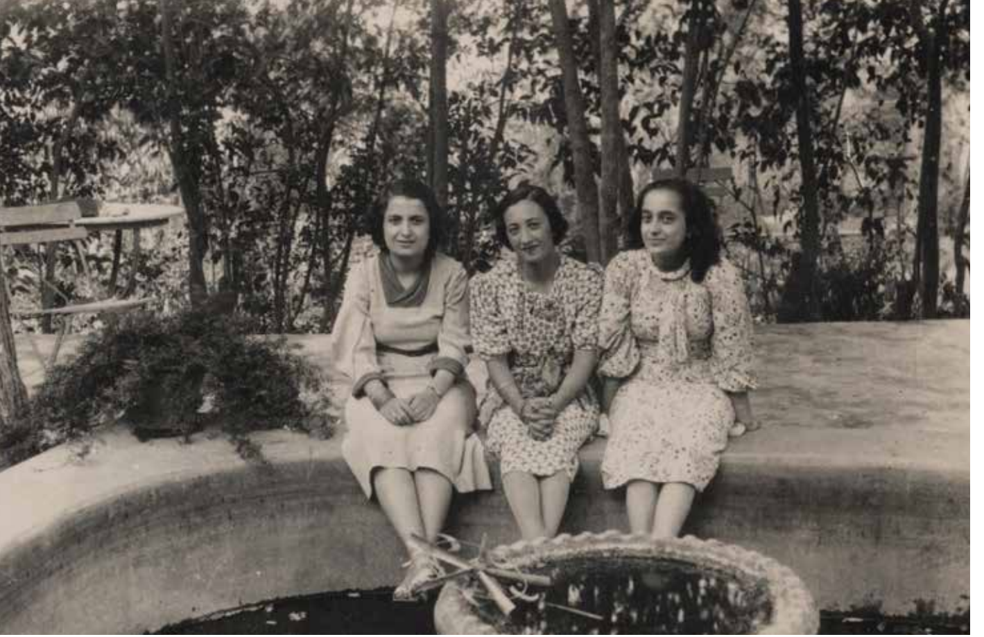
23 Ağustos 1937, Göztepe'de yeşillikli bir bahçe içinde süs havuzunun yanında yan yana poz veren elbiseli üç genç kadının fotoğrafı.