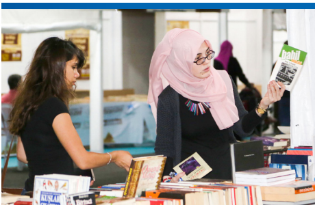
KÜÇÜKÇEKMECE'DE RENKLİ RAMAZAN AKŞAMLARI