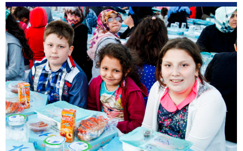
KÜÇÜKÇEKMECE'DE ÇOCUKLAR İÇİN İFTAR VAKTİ