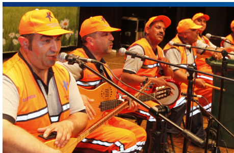
TEMİZLİK İŞÇİLERİNDEN CANLI PERFORMANS