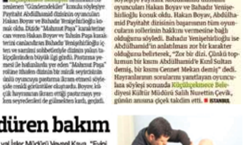
OYUNCULAR, PAYITAHT ABDÜLHAMİD'İ ANLATTI