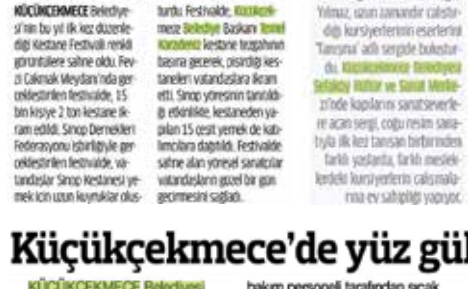
KÜÇÜKÇEKMECE BELEDİYESİ BİRLİĞİYLE ATILAN KİTİP VE SAĞAT MÜZİK VE SAĞAT MÜZİKLERİNE SAĞLIKLI YAŞAM PROGRAMI