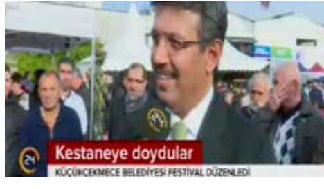
Kestaneye doydular KÜÇÜKÇEKMECE BELEDİYESİ FESTİVAL DÜZENLEDİ