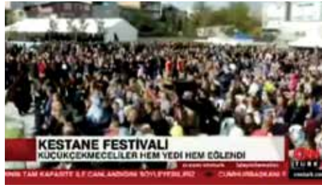
KESTANE FESTİVALİ KÜÇÜKÇEKMECELİLER HEM YEDİ HEM EĞLENDİ