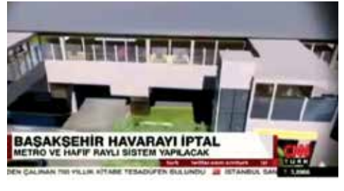
BAŞAKŞEHİR HAVARAYI IPTAL METRO VE HAFIF RAYLI SİSTEM YAPILACAK