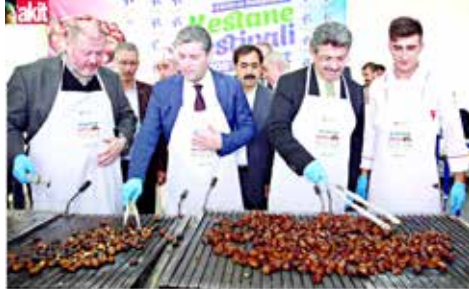
TEME KARADENİZ KÜÇÜKÇEKMECE BELEDİYESİ BAŞKANI