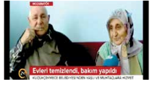
Evleri temizlendi, bakım yapıldı KÜÇÜKÇEKMECE BELEDİYESİ'NDEN YAŞLI VE MÜNTAZALARA HİZMET