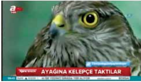
AYAGINA KELEPÇE TAKTILAR