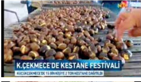
K.ÇEKMECE'DE KESTANE FESTİVALİ KÜÇÜKÇEKMECE'DE 15 BİN KİŞİYE 2 TON KESTANE İKRAM EDİLDİ