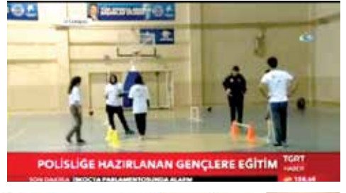
POLİSLİĞE HAZIRLANAN GENÇLERE EĞİTİM