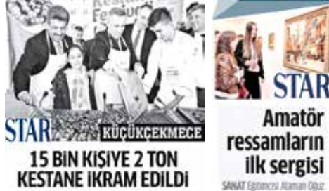
KÜÇÜKÇEKMECE 15 BİN KİŞİYE 2 TON KESTANE İKRAM EDİLDİ