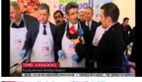
TEME KARADENİZ KÜÇÜKÇEKMECE BELEDİYESİ BAŞKANI