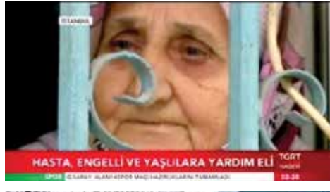
HASTA, ENGELLİ VE YAŞLI LARA YARDIM ELİ